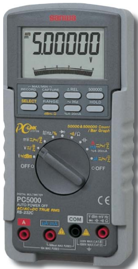
Fot. 7. Multimetr PC5000

syfikowane pod względem możliwości pracy w określonych warunkach. Precyzują to tzw. kategorie pomiarowe, np. kategoria III oznacza dopuszczenie mierników do pomiarów instalacji budynków, a kategoria IV oznacza pomiary w źródle zasilania z sieci niskiego napięcia. Przykładowo, miernik BM829 ma 1000 V dla kat. IV, a mierniki KEW1602 i METRAHIT OUTDOOR 600 V dla kat. IV.