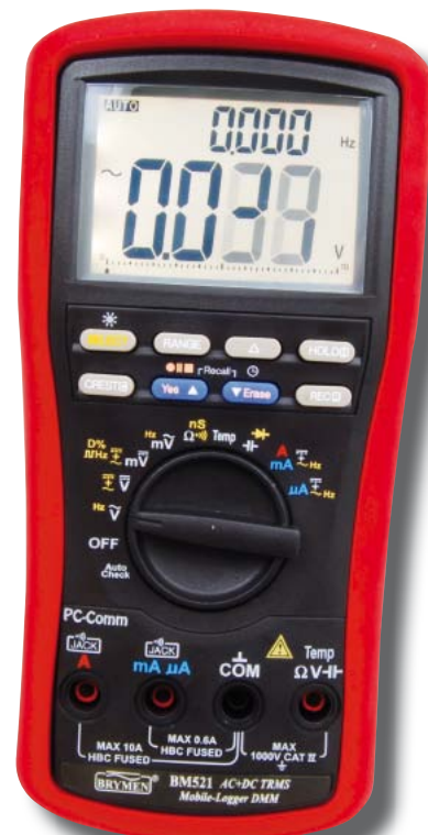
Fot. 5. Multimetr BM521

Odrębnym zagadnieniem podczas korzystania z miernika jest bezpieczeństwo użytkownika, szczególnie w czasie wykonywania pomiarów napięcia i natężenia prądu, chociaż warunki zawarte w odpowiednich normach dotyczą wszystkich trybów pomiarowych. Stosowna norma (IEC 61010-1)