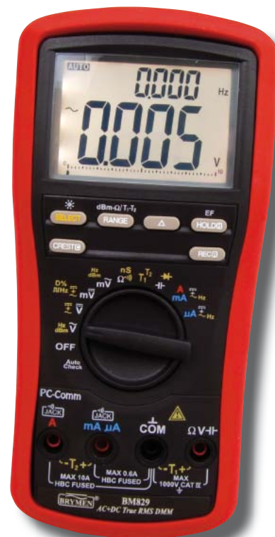
Fot. 6. Multimetr BM829

mówi, że „Multimetry i podobne przyrządy nie mogą być źródłem jakiegokolwiek zagrożenia, bez względu na rodzaj użytego napięcia zasilania, ustawioną funkcję pomiarową czy zakres. Pod pojęciem „zagrożenie” rozumie się: porażenie prądem elektrycznym, pożar, iskrzenie, wybuch.”. Dla przyrządów pomiarowych, w tym multimetrów, określane jest minimalne napięcie, jakie po przyłożeniu do zacisków pomiarowych nie spowoduje przebicia. Mierniki są ponadto kła-