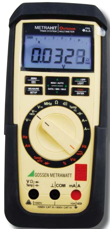
Fot. 3. Multimetr METRAHIT OUTDOOR

ne) ze składową stałą. Amplituda jest równa U_m = 2\text{ V} , a składowa stała U_{\text{offset}} = 3\text{ V} . Do wyboru mamy trzy tryby pomiarowe. Jest to: – pomiar napięcia stałego VDC – wybierając go miernik ignoruje składową zmienną i wskaże wartość składowej stałej, czyli 3 V; – pomiar napięcia zmiennego VAC – w tym przypadku będzie odwrotnie, miernik zi-