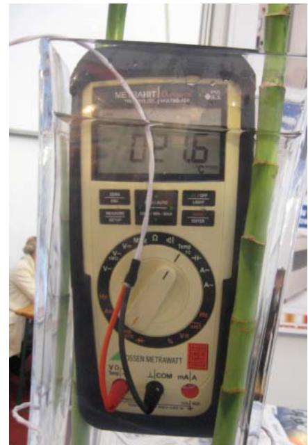
Fot. 13. Multimetr w ciężkich warunkach pracy

Liczne funkcje pomiarowe dostępne w multimetrach sprawiają trochę problemów konstruktorom w zakresie ich uaktywniania. Przywykliśmy wszyscy do okrągłych przełączników obrotowych wspomaganych dodatkowymi przyciskami. Jedną pozycją przełącznika może odpowiadać dwóm, a nawet trzem funkcjom, które są włączane po odpowiednim ustawieniu przełącznika obrotowego, a następnie naciśnięciu wybranego przycisku (czasami wielokrotnie). W mierniku APPA305 zastosowano nieco odmienną filozofię podpatrzoną z oscyloskopów cyfrowych. Pod wyświetlaczem umieszczono 4 przyciski funkcyjne, których aktualne znaczenie jest sygnalizowane stosownym napisem wyświetlanym nad danym przyciskiem (rys. 12). Podejście takie spowodowało, że mimo dużych rozmiarów wyświetlacza, cyfry wyniku pomiaru są stosunkowo małe. Na szczęście jakość wyświetlacza jest bardzo dobra, więc komfort pracy został zachowany. A skoro już jesteśmy przy tym temacie, to trzeba niestety wspomnieć o rezygnacji przez większość producentów z niezależnych wyłączników zasilania, jakie były stosowane w starych konstrukcjach mierników. Umieszczanie takich wyłączników w przełączniku obrotowym sprawia, że