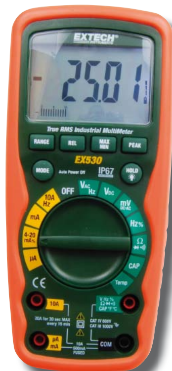
Fot. 9. Multimetr Extech EX530

Typowymi funkcjami analizy danych jest wyszukiwanie minimów i maksimów w sesji pomiarowej, obliczanie wartości średniej, zatrzymywanie wyniku na wyświetlaczu (HOLD), pomiar względny (róż-