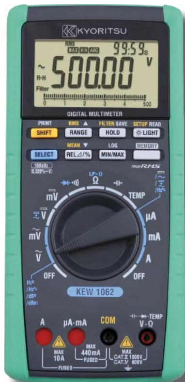
Fot. 4. Multimetr KEW1062