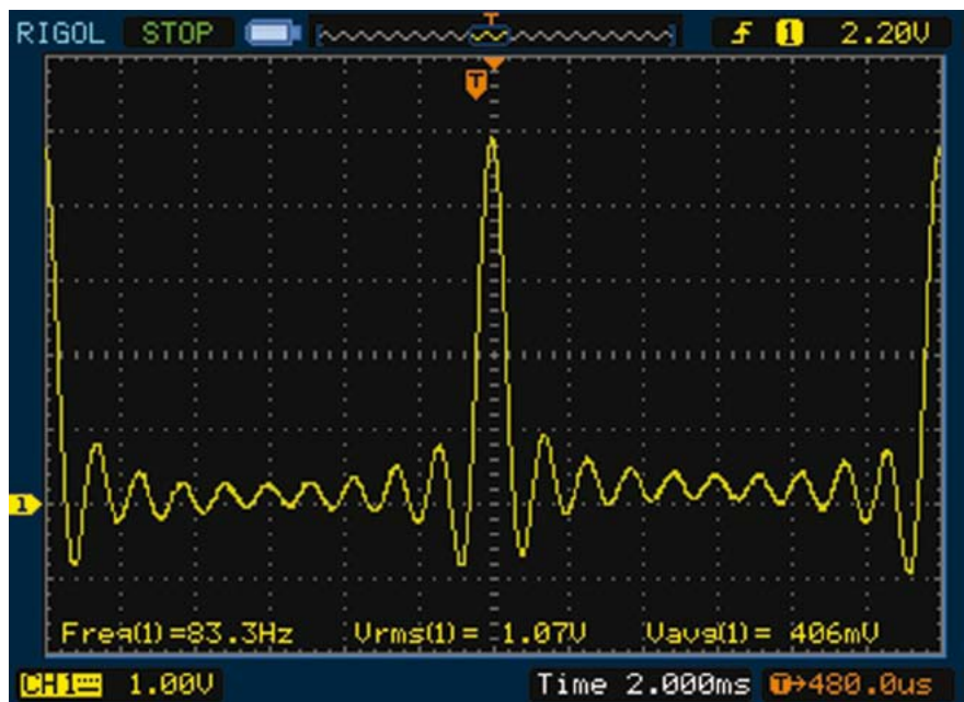
Rys. 2. Przebieg zastosowany do porównania wyników pomiaru AC+DC w testowanych multimetrach