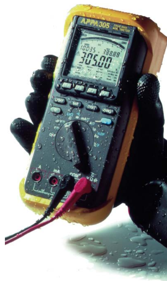
Fot. 10. Multimetr APPA305

nicowy) przydatny przy porównywaniu parametrów dwóch elementów lub urządzeń. W pomiarach różnicowych wynik może być podawany w wartościach bezwzględnych lub w procentach. Specyficznym rodzajem pomiarów względnych są pomiary w skali logarytmicznej (dBm i dBV). Pomiar dBm