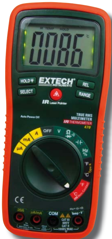
Fot. 11. Multimetr EX470

określa stosunek aktualnie mierzonego napięcia do takiego napięcia, które powodowałoby wydzielanie się mocy równej 1 mW na rezystancji odniesienia. Konieczne jest więc zdefiniowanie tej rezystancji, co najczęściej jest możliwe poprzez wybranie jednej z kilku standardowych wartości, i ustawienie jej jako wartość domyślna w setupie miernika.