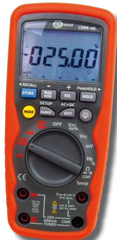
Fot. 8. Multimetr CMM-40

Pomiar częstotliwości i współczynnika wypełnienia. O pomiarze częstotliwości podczas pomiaru napięcia lub prądu AC była już mowa. Wtedy był to pomiar uproszczony, tym razem chodzi o wyodrębnioną funkcję